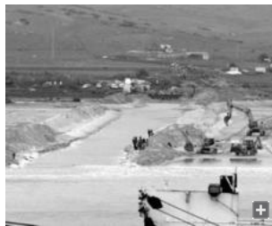
Obras del segundo cable de Tarifa, en 2006.

Según apuntó el primer edil, proyectos tan necesarios como la electrificación de los núcleos rurales y el abastecimiento de agua al Álamo, Betis, Betijuelo y Las Cumbres, "que siguen un trámite que es complejo y lento", van a seguir su curso hasta que estén completados. Se trata de una cantidad estipulada en 1.167.088 euros, librada, disponible y se aplicará a estos proyectos.