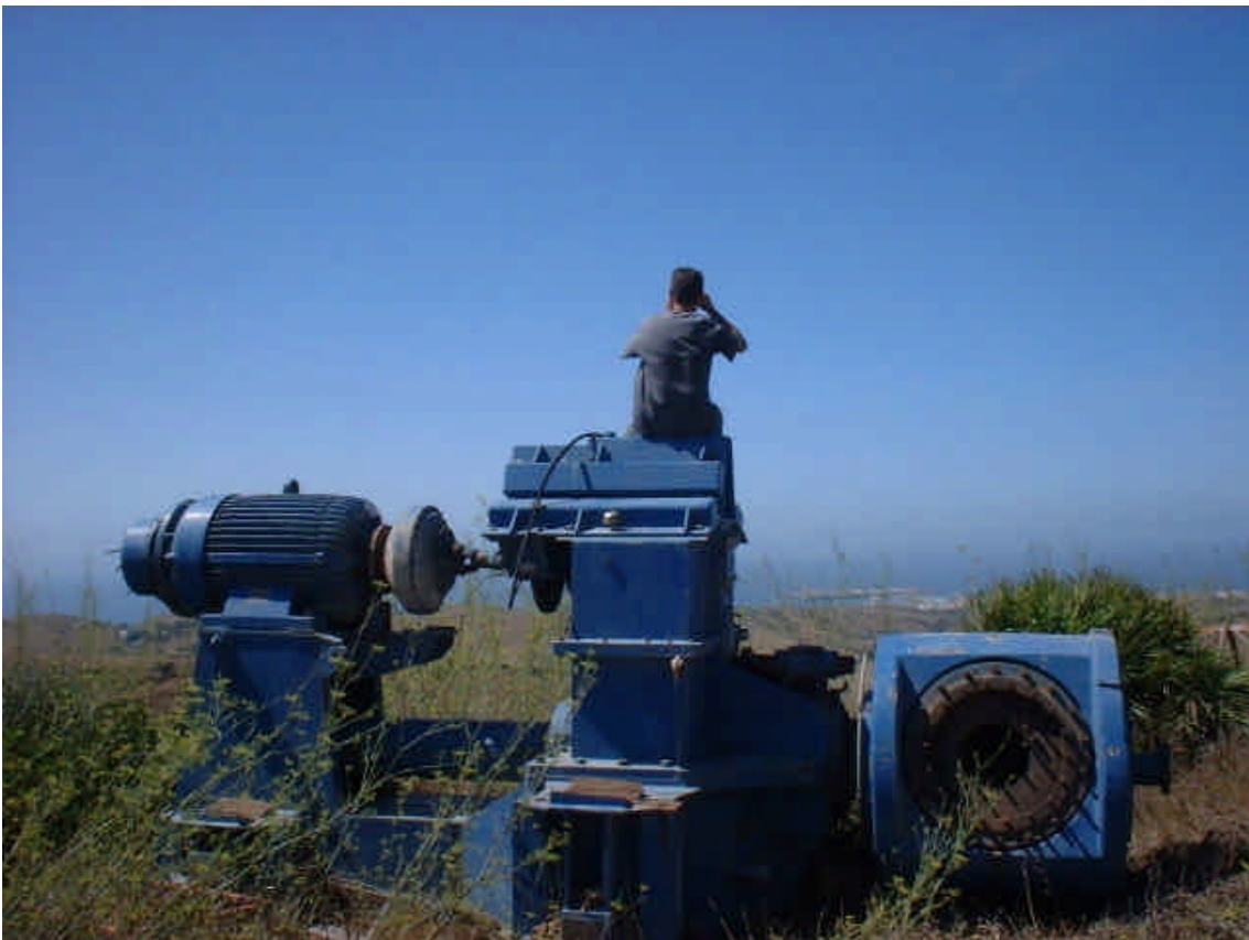
Observatorio de Aves de Cazalla – Tarifa